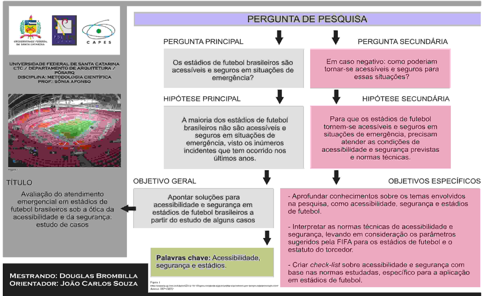
Figura 1 http://repositorio.ufsc.br/bitstream/handle/2012-2/10118/aprovacao-de-tdj-em-ordem-via-sistema-por-tempo-estudante-minuta.html Acesso: 08/11/2017