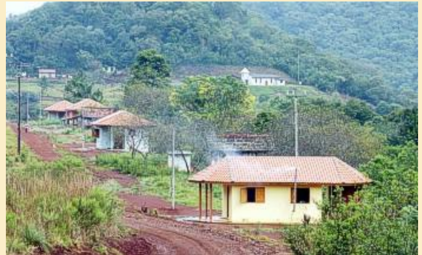
Imagens: Casa da família indígena.