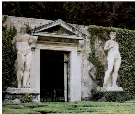
Jardim da Vila Madama – Rafael Sanzio Roma – sec. XV

Fonte: Microsof. Enciclopédia Multimídia Encarta