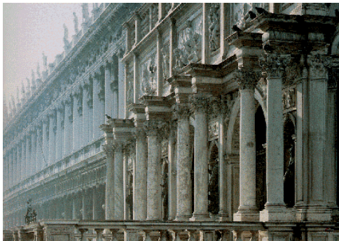
Logetta do Campanile da Biblioteca Marciana – Jacopo Sansovino Veneza – sec. XVI

A planta centrada foi importante pelo que determinou como espaço interno. Existe nela uma plástica ascensorial progressiva, coroada pela cúpula, cujo sentido simbólico é evidente. O espaço é contido num proporcionamento humanizado, gradativo, sem usar a dominante vertical do espaço gótico, senão cristalizado numa concepção intelectual bem definida, contida dentro dos limites exatos e legíveis. A cúpula, no Renascimento, constitui o coroamento final da composição, marcada como plástica interna e externa, encerrando um espaço preciso e inteligível. (Destaca-se a Catedral de Santa Maria del Fiore em Florença e São Pedro em Roma)