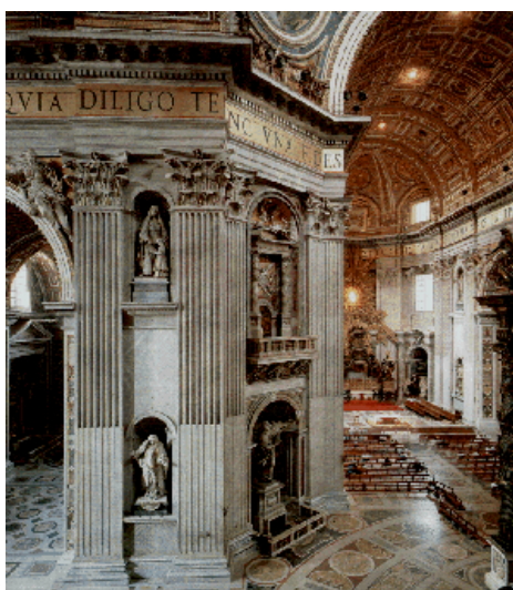
Basílica de São Pedro – Michelangelo Vaticano – Roma – séc. XV