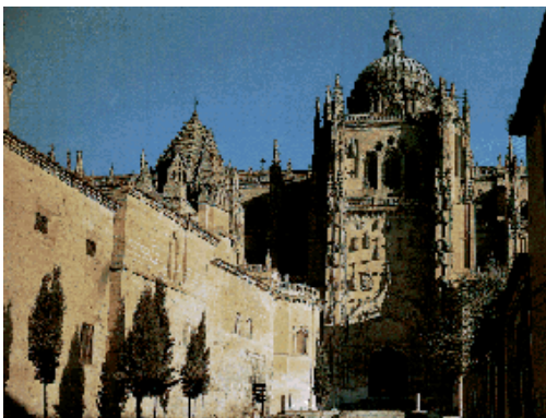
Catedral de Juan Gil Hontanón Nova Salamanca- séc. XVI