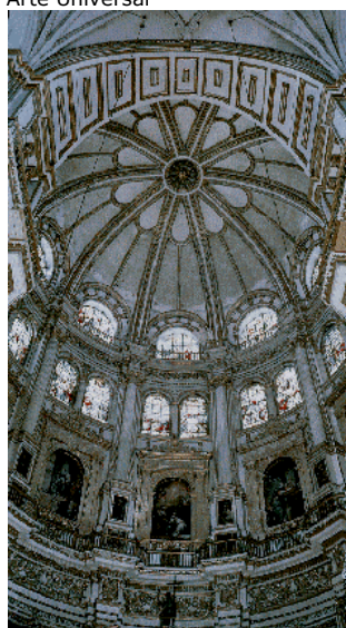
Cúpula da Basílica de São Pedro Michelangelo / Roma – Séc. XV