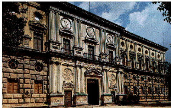
Palácio de Carlos V – Pedro de Machuca Alhambra – Granada – sec. XVI